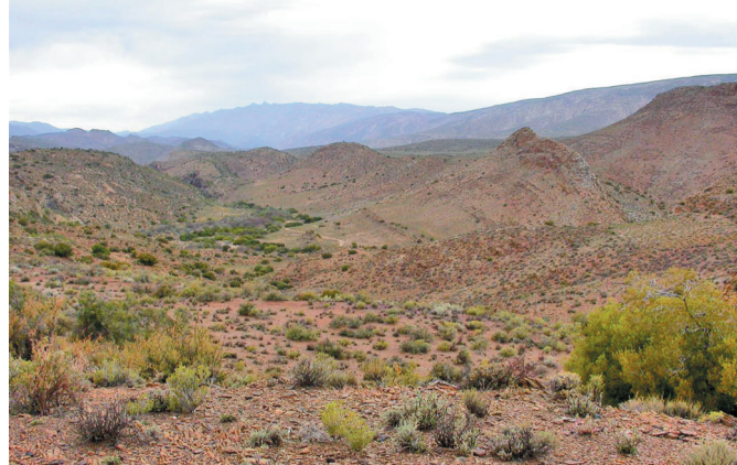
Só lyk 'n deel van die Grand Canyon-grondgebied wat 'n groot aanwys vir natuurbewaring in die Klein-Karoo is.

Die Grand Canyon-deel is deur die Wêreld-Natuur-