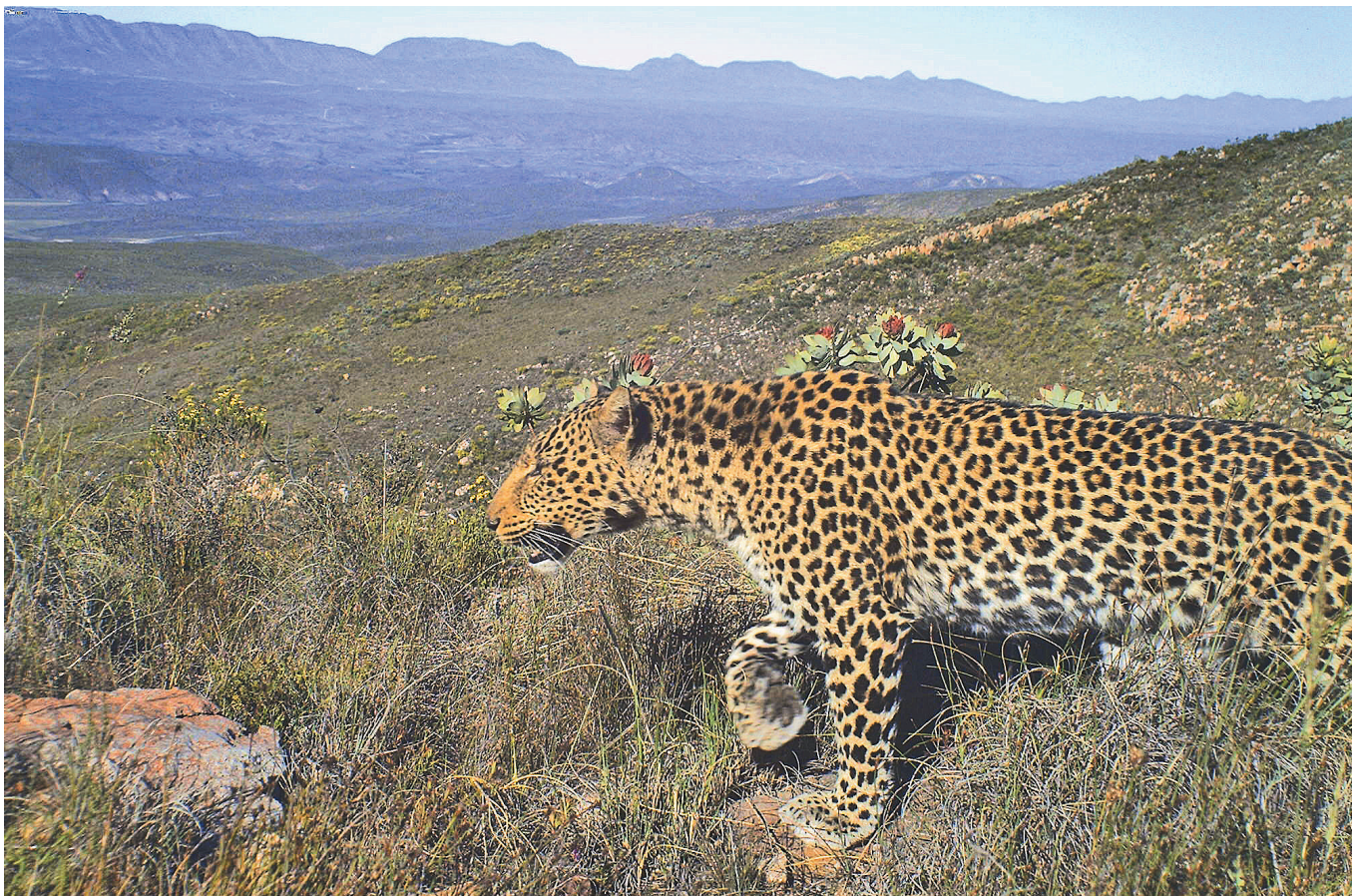
Kyk hoe stap die luiperd deur die Klein-Karoo. Die laaste korridor is bygevoeg om die Anysberg-reservaat met die Baviaanskloof te verbind oor berggebiede soos die Klein- en die Groot-Swartberge.

“Die eko-wagters help ons om data te versamel,” het Martins gesê.